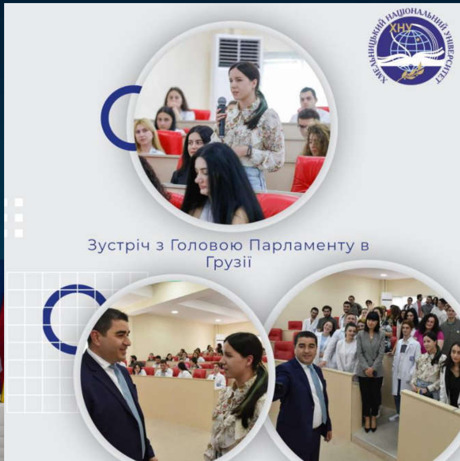
Зустріч з Головою Парламенту в Грузії