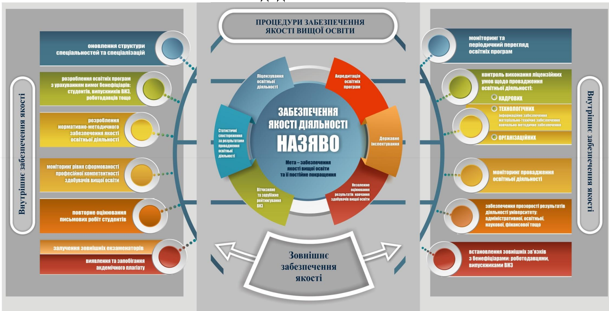
Рисунок 1 – Процедури забезпечення якості вищої освіти в Україні